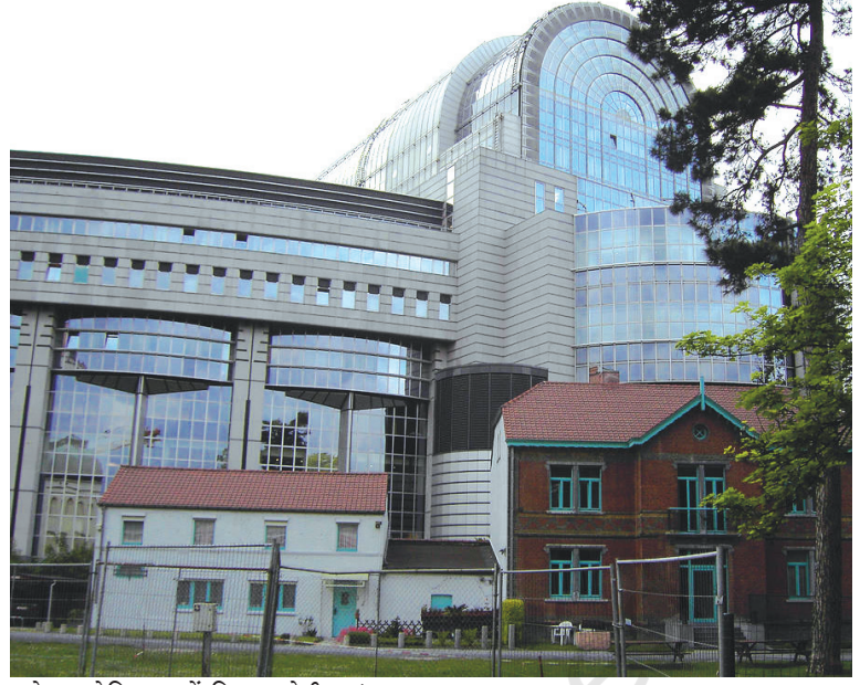
ब्रूसेल्स, बेल्जियम में स्थित यूरोपीय संसद

आपको बेल्जियम का मॉडल कुछ जटिल लग सकता है। निश्चित रूप से यह जटिल है—खुद बेल्जियम में रहने वालों के लिए भी। पर यह व्यवस्था बेहद सफल रही है। इससे मुल्क में गृहयुद्ध की आशंकाओं पर विराम लग गया है वरना गृहयुद्ध की स्थिति में बेल्जियम भाषा के आधार पर दो टुकड़ों में बँट गया होता। जब अनेक यूरोपीय देशों ने साथ मिलकर यूरोपीय संघ बनाने का